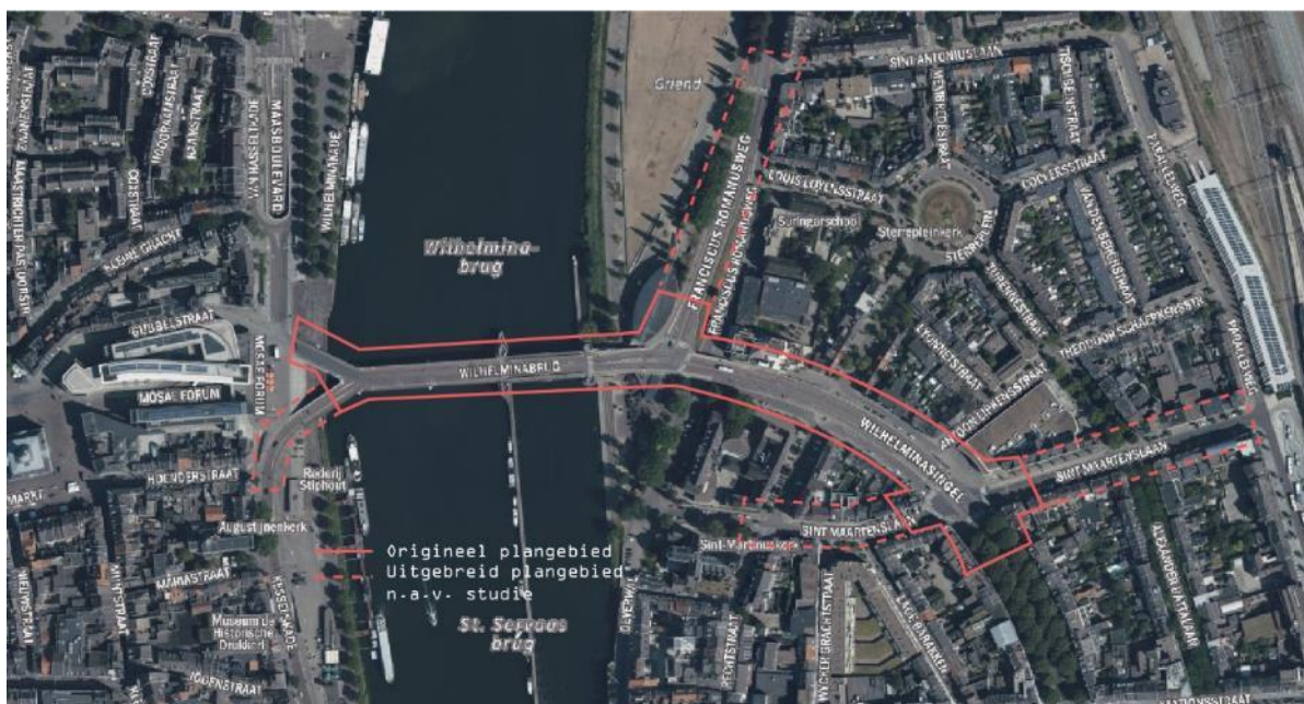
Afbeelding 4.1: Plangebied

In de tweede stap zijn de verkeersstromen, conflictpunten en alternatieven schematisch in beeld gebracht. Per kruispunt en wegvak zijn alle mogelijke posities voor fietsers en voetgangers in beeld gebracht. Dit heeft geleid tot 44 ontwerpbouwstenen. Deze bouwstenen zijn beoordeeld op hun positieve en negatieve aspecten. In de derde stap zijn de losse bouwstenen per wegvak en kruispunt met elkaar gecombineerd tot verschillende varianten. Deze varianten zijn beoordeeld op hun (on)mogelijkheden. Dit is steeds in overleg met de klankbordgroep(en) gedaan. Dit heeft uiteindelijk geleid tot een voorkeursvariant. Deze variant is tijdens een inloopbijeenkomst op 12 juli 2022 gepresenteerd aan geïnteresseerden. Dit ontwerp is uiteindelijk uitgewerkt tot een definitief ontwerp.