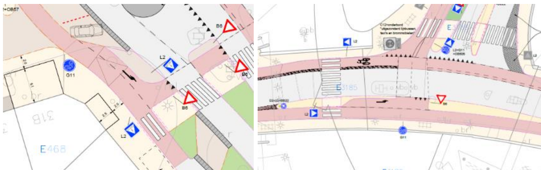
Afbeelding 8.1: Opstelstroken voor linksafslaande fietsers

Burgemeester en Wethouders van Maastricht,