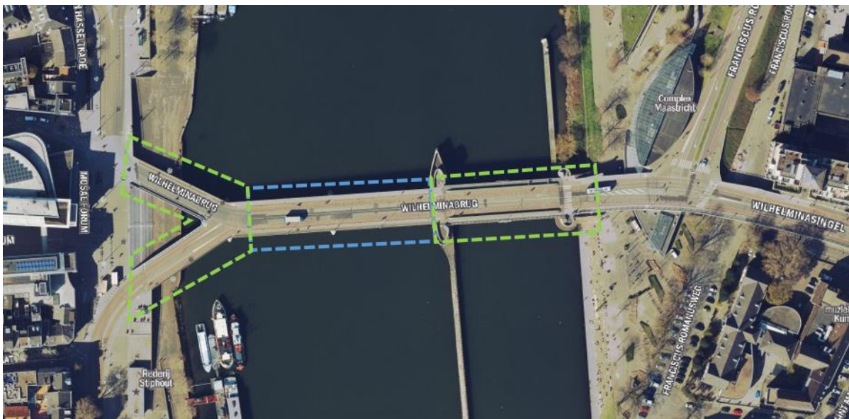
Afbeelding 4.4: Beheersgrenzen Wilhelminabrug

Rijkswaterstaat (RWS) is eigenaar van de Wilhelminabrug met uitzondering van de Y-splitsing. Deze was onderdeel van het Markt-Maasproject en volledig in beheer en eigendom van Gemeente Maastricht. Het stalen gedeelte van de brug (blauw kader), is in beheer van RWS. De asfaltverharding maakt deel uit van de conservering van het stalenbrugdek. De gemeente is wegbeheerder van het asfalt op het betonnen brugdek (groen kader) boven de vaargeul. RWS is hier wel eigenaar. Zie hieronder de grove indeling in tekening.