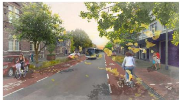
Afbeelding 4.2: Impressie eindbeeld Wilhelminasingel en Sint Maartenslaan

Het tweerichtingen fietspad aan de westzijde van de Franciscus Romanusweg zorgt ervoor dat een deel van de conflicten tussen fietsers en gemotoriseerd verkeer op het kruispunt Franciscus Romanusweg – Wilhelminasingel kan worden opgelost. Dit betreft vooral de conflicten tussen fietsers van de Wilhelminabrug naar de Franciscus Romanusweg en gemotoriseerd verkeer van de Franciscus Romanusweg naar de Wilhelminasingel. Doordat deze verkeersstromen elkaar niet meer kruisen, kunnen bestuurders vanuit de Franciscus Romanusweg zich focussen op verkeer van en